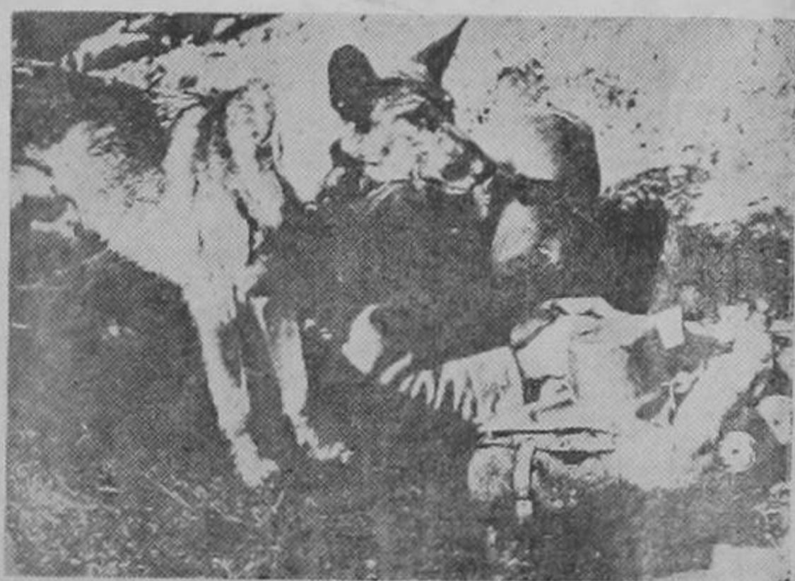
Los perros prestan inestimable servicio en la guerra. Este con su amo en una trinchera del frente francés, espera el mensaje que habrá de llevar a su lugar de destino.

extremos: algunas están libres del cargo de confiscación de propiedades y repudiación de sus compromisos, pero otras no. No puede por lo tanto suponerse que el mercado de capital estará igualmente abierto para todas sin tomarse en cuenta esa experiencia. Es posible que se trate de limpiar de obstáculos el camino en ese sentido, pero esto no es fácil"